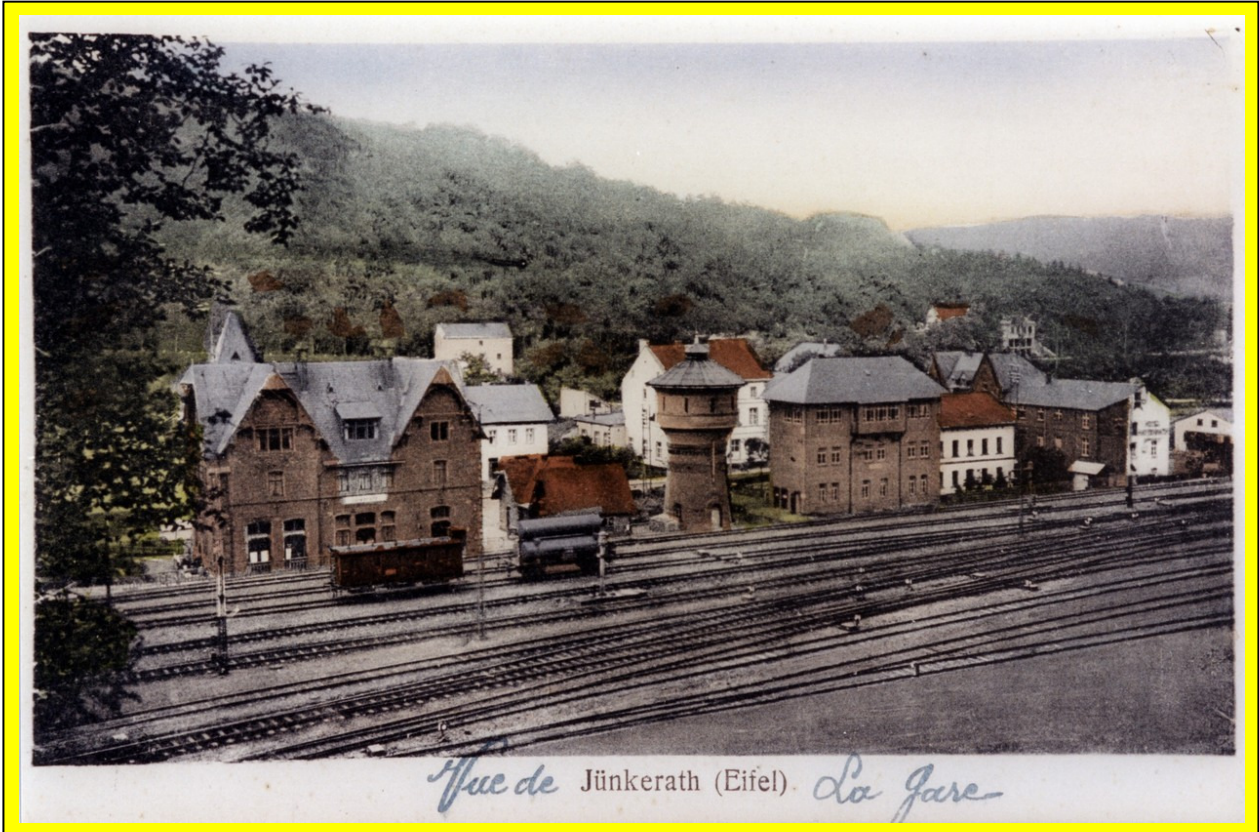
Vue de Jünkerath (Eifel) La Gare